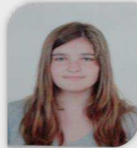
Diretora Financeira e de TIC