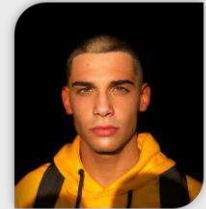
Diretor de Recursos Humanos