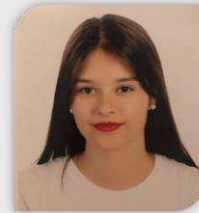
Presidente e Diretora de Vendas