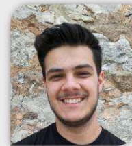
Diretor de Marketing