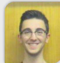
Diretor de Produção